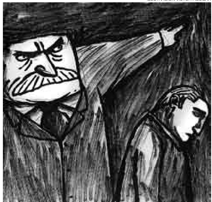
ILUSTRACIÓN VÍCTOR AGUILAR

de los migrantes ilegales, se pone en cuestión el buen trato con esos terceros. Especialmente cuando este quería basarse en una aproximación que, como el "diálogo de civilizaciones", se presentaba como alternativa al huntingtoniano "conflicto de civilizaciones".