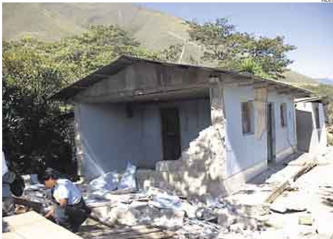
INCOMUNICADOS. El sismo no dejó víctimas, pero sí ha incomunicado a todo el distrito de Huancabamba.