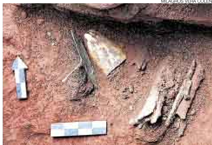
PARA INVESTIGAR. Las piezas arqueológicas serán examinadas en laboratorios especiales y luego puestas en exhibición.

3 Además intenta recuperar todo tipo de material cultural enterrado para determinar su ocupación secuencial en la zona.