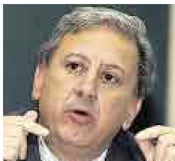
GARRIDO. Pide paciencia.

"Esta no es una experiencia que tengamos que aplaudir, ya que solo demuestra que los actores políticos del país están perdiendo la capacidad de diálogo.