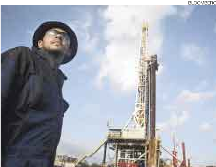
NI UNO NI OTRO. El petróleo podría llegar pronto a US$150 por barril, y mientras el dólar no se recupere, el precio no caerá, dicen los analistas.

Pero además habría razones de fundamento económico en este salto, como afirma el jefe de la Agencia Internacional de Energía de EE.UU., Nobuo Tanaka, quien asegura que “el mundo está experimentando su tercer choque del precio del petróleo”, al comparar el alza actual con las ocurridas en 1973 (embargo petrolero árabe) y 1979 (revolución en Irán). Además, el secretario del Tesoro de