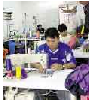
PROMOCIÓN. Las mypes esperan una entidad similar a Prompyme.