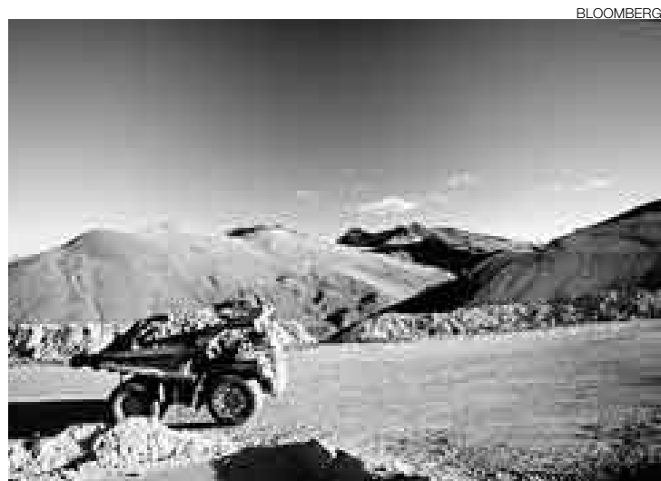
PROYECTOS. La construcción de carreteras con fondos del canon será una respuesta a las demandas de la población de las diversas regiones.

Rodríguez comentó que solicitará al Ministerio de Transportes y Comunicaciones (MTC) cumplir un convenio firmado meses atrás para acelerar los estudios de