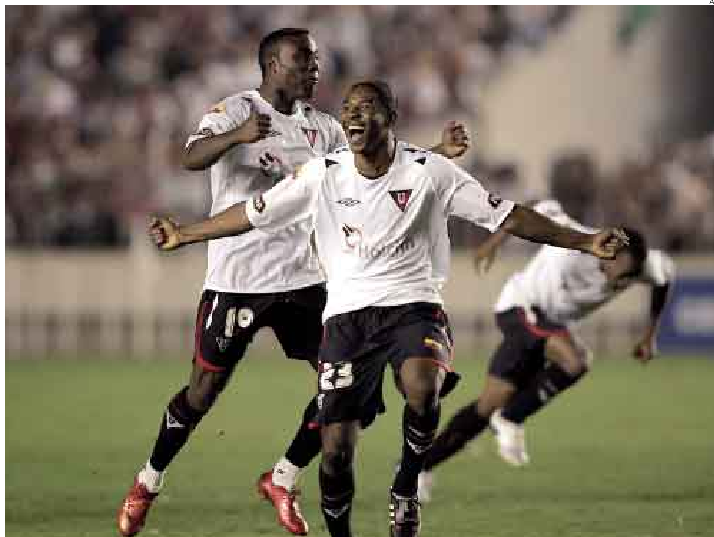
JUSTO Y MERECIDO. Pese al dubitativo primer tiempo, el once del 'Patón' Bauza pudo controlar la embestida de 'Flu' y se quedó con el título.