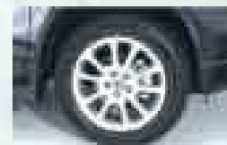
Aros de aleación de 18"