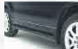
Estribos laterales planos

*TODOS LOS HONDA VIENEN CON BLUETOOTH™. TODOS DE MOTOROLA. PROMOCIÓN VÁLIDA HASTA EL 31 DE JULIO.