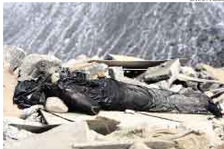
EL CRIMEN QUE NO FUE. Tres cuerpos, que resultaron ser solo muñecos, fueron dejados a orillas del mar, en el distrito de Magdalena.