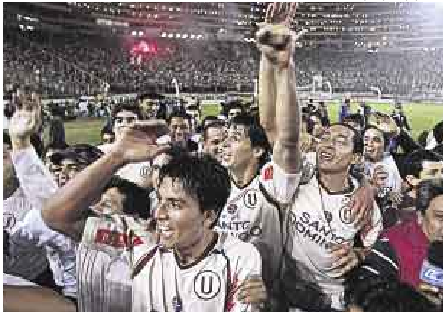
A TODO PULMÓN. Jugadores, cuerpo técnico, hinchas... Todos gritaron ¡campeón! anoche.