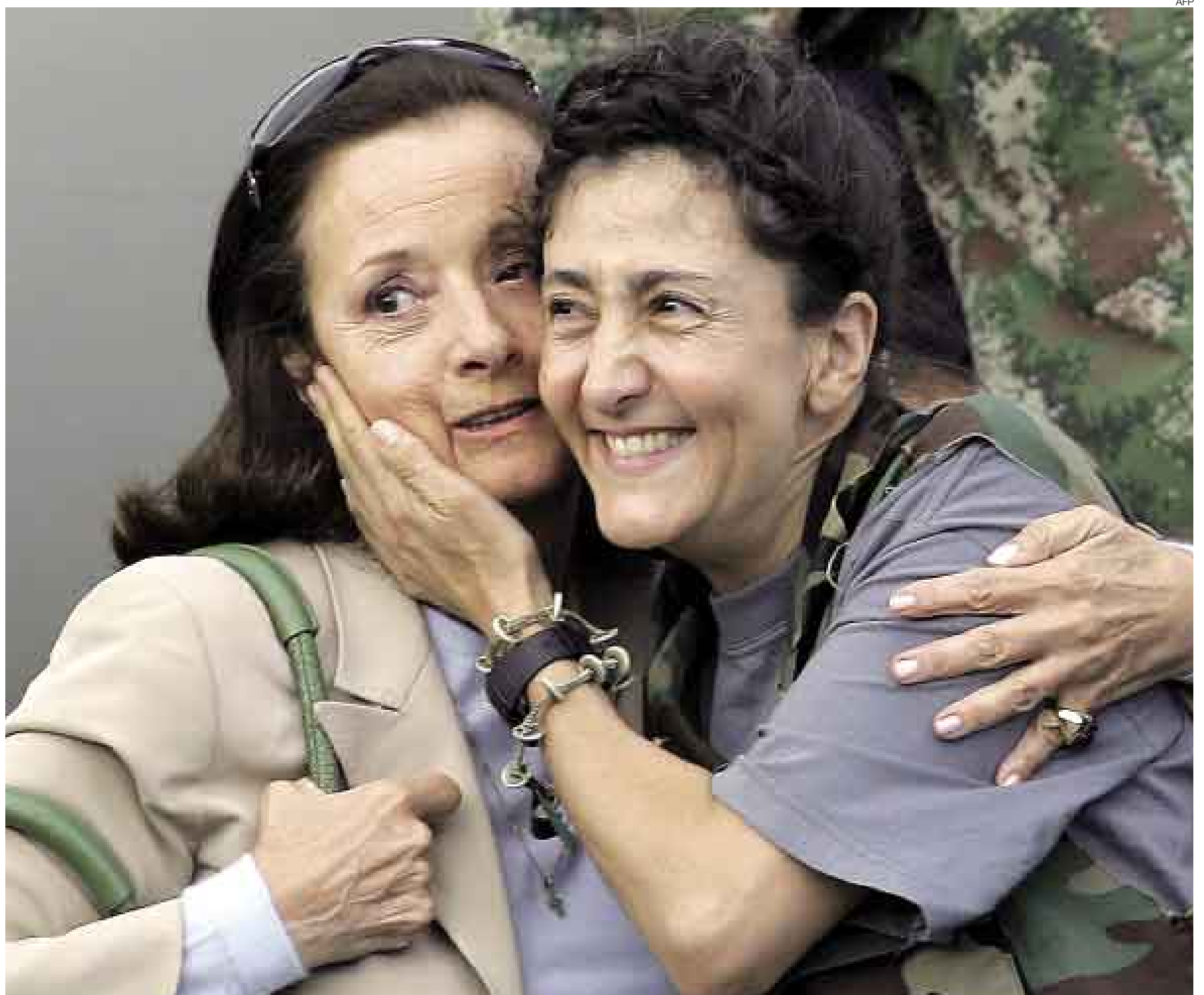
SEIS AÑOS SIN VERSE. El abrazo con su madre, Yolanda Pulecio, demoró, pero finalmente se hizo realidad. Ingrid Betancourt (derecha) pidió la liberación de todos los rehenes de las FARC.

Los 12 colombianos llegaron a Bogotá y se confundieron entre abrazos y lágrimas con sus familiares, y rezaron de rodillas. Los estadounidenses retornaron a su país. [A2, 3 y 4]