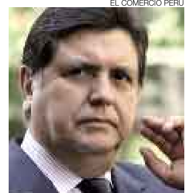
FELICITACIÓN. Presidente Alan García Pérez.

bién mostró su satisfacción mediante un comunicado en el cual ratificaba lo expresado por el presidente García.