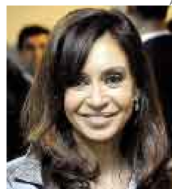
APLAUDE. Cristina Fernández, presidenta de Argentina.

En Buenos Aires, la presidenta Cristina Fernández, envió sus saludos a Ingrid y a su madre. Yolanda Pulecio. “Es una victoria de la vida