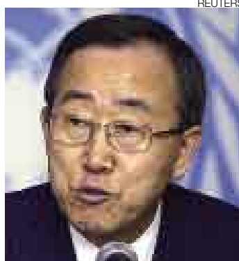
SALUDO. Ban Ki Moon, secretario general de la ONU.

México pidió a las FARC que liberen a las cientos de personas que mantienen secuestradas. “Al expresar su beneplácito, el Gobierno de México reitera que resulta impensable que las FARC atiendan los llamados de la sociedad colombiana y de la comunidad internacional y den paso a la liberación de todas las personas a las que aún mantienen privadas de su libertad”, dijo la cancillería mexicana en un comunicado.