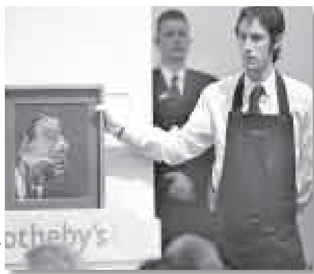
El estanque de las ninfas, de Monet (izquierda) y Estudio de la cabeza de George Dyer, de Bacon.

Estas ventas llegan en un momento errático para el mercado del arte. La