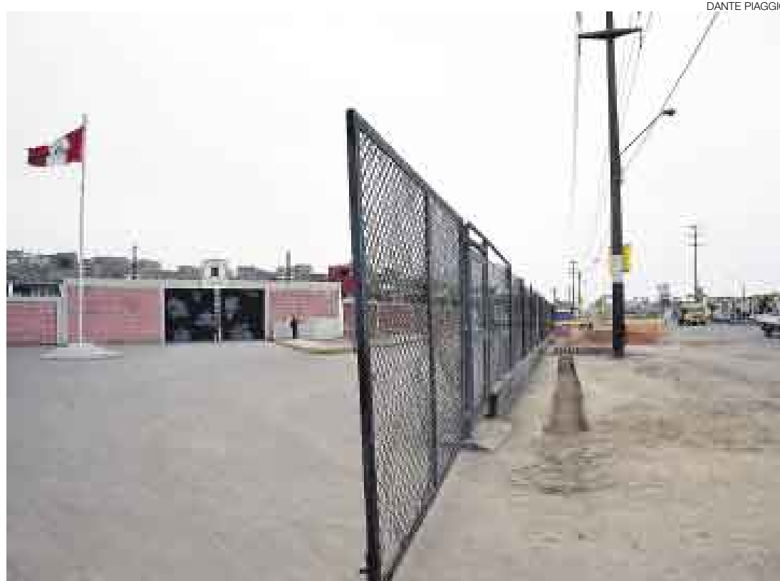
NUEVA CÁRCEL. El cuartel de Tarapacá se está habilitando como centro penitenciario. Abrirá en tres meses.