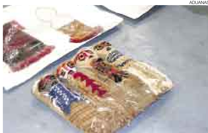
EN INVESTIGACIÓN. El INC evalúa los huacos y textiles incautados ayer.

La Sunat incautó ayer bienes culturales que iban a salir del país. En una primera acción realizada en el aeropuerto Jorge Chávez se decomisaron a un pasajero huacos y textiles preíncas, monedas coloniales, un libro en latín y dos tablillas de origen iraquí. En la segunda, realizada en una zona de carga aérea, se descubrieron tres paquetes con muñecas Wari. No se han identificado a los responsables.