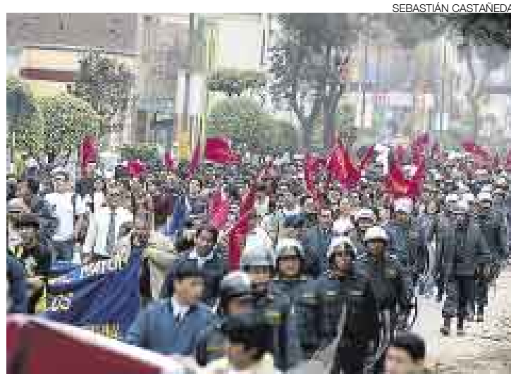
PROTESTA. Los estudiantes sanmarquinos marcharon por las calles de Lima. A su paso ocasionaron un gran caos vehicular en el centro.

Entre las 10 a.m. y 2 p.m. de ayer, los sanmarquinos marcharon desde la Ciudad Universitaria hasta el Congreso para solicitar que dicho poder del Estado obligue al Concejo de Lima a suspender las obras.