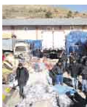
RAPIDEZ. La intervención realizada en Juliaca duró 25 minutos.

Personal de Aduanas y la policía incautaron ayer mercadería de contrabando valorizada en US$150 mil. Para ello utilizaron una nueva táctica que consiste en intervenir a los contrabandistas, no en el camino, sino en sus centros de acopio. Los productos incautados ayer en un almacén de Juliaca pertenecerían a una banda de traficantes conocida como 'La Culebra del Norte'.