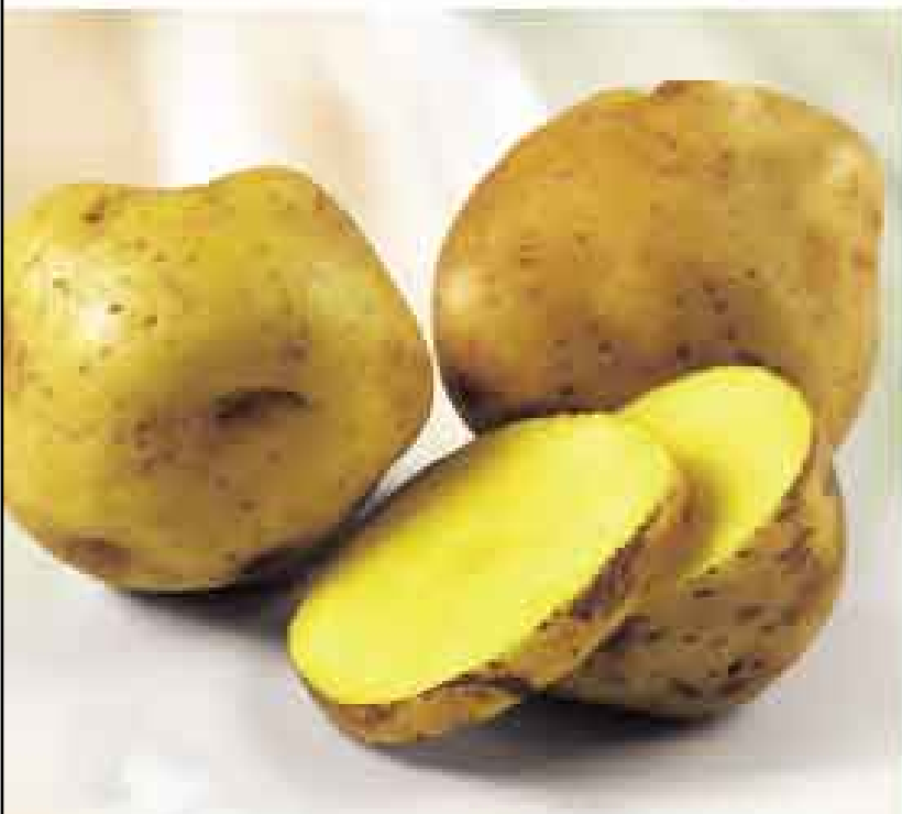
Papa amarilla tumbay kg de S/. 2,20 a