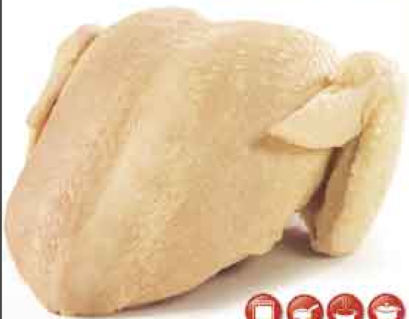
Pechuga con ala de pollo natural kg de S/. 12,50 a