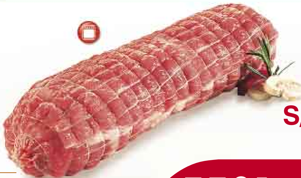
Lomo enrollado de cerdo kg de S/. 20,95 a

* El producto se vende fresco en su estado original.