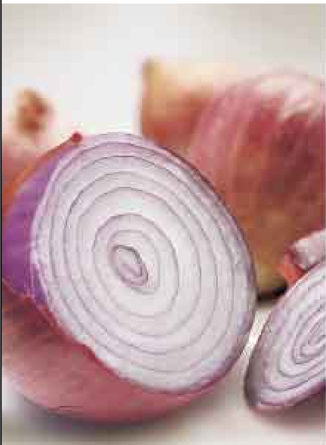
Cebolla roja extra kg de S/. 2,10 a