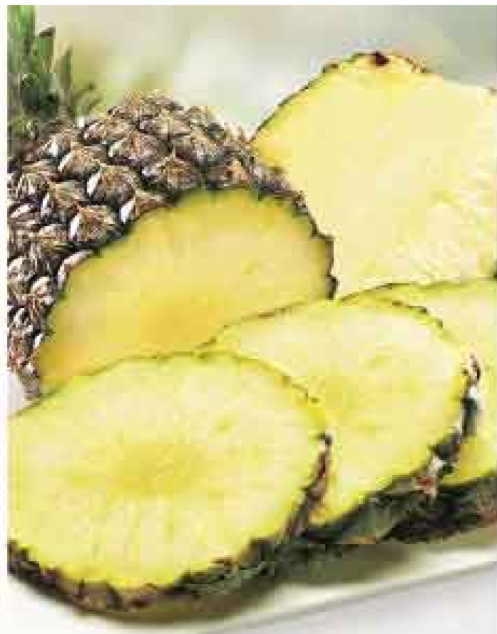
Piña para jugo kg de S/. 1,10 a