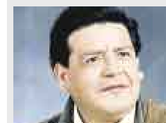
FIRME. Alcalde César Acuña.

■ MOQUEGUA. Ayer se instaló en la capital del departamento una mesa de diálogo en la que participan autoridades locales y funcionarios del Ejecutivo. Ellos discutirán sobre los diversos proyectos que el Ejecutivo se comprometió a financiar tras la revuelta ocurrida hace unas semanas. Se informó que se han formado varios grupos de trabajo y los pobladores están atentos a los avances que se logren.