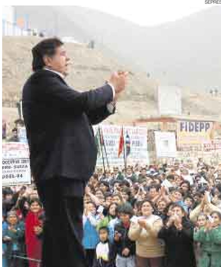
SIN IMPORTANCIA. El mandatario restó importancia a la acción de protesta que promueve la CGTP. Dijo que los peruanos seguirán trabajando.

“¿Qué hacemos en el Perú? ¿Nos ponemos a llorar? ¿Damos decretos supremos para que los árabes bajen el petróleo del mundo?”, bromeó García. Luego señaló que a esta situación mundial no se puede responder de manera irracional.