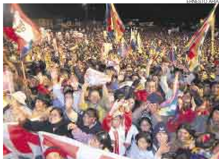
MITIN. Políticos deben informar acerca de quiénes financian sus actividades.