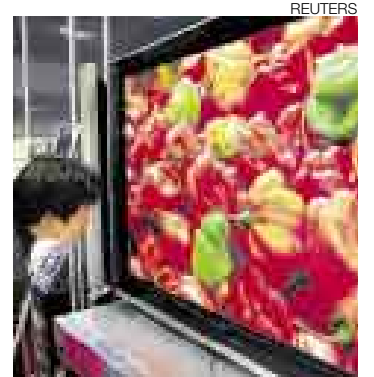
EN LA MIRA. Lanzan alerta sobre los televisores de plasma.