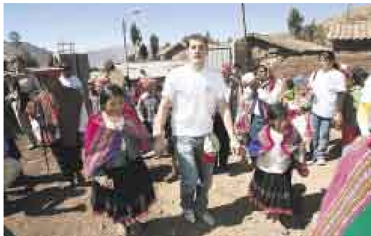
A MANO. Casillas se había comprometido a viajar al Perú y cumplió.

tragueño fueron recibidos bajo una lluvia de rosas y declarados ilustres visitantes por el alcalde de Patabamba. La banda local regalaba sonidos típicos y el sol empezaba a desafiar a la piel. Los niños mostraban carteles de bienvenida a los nuevos ídolos aun cuando desconocían el valor de la presencia de ambos personajes que el día