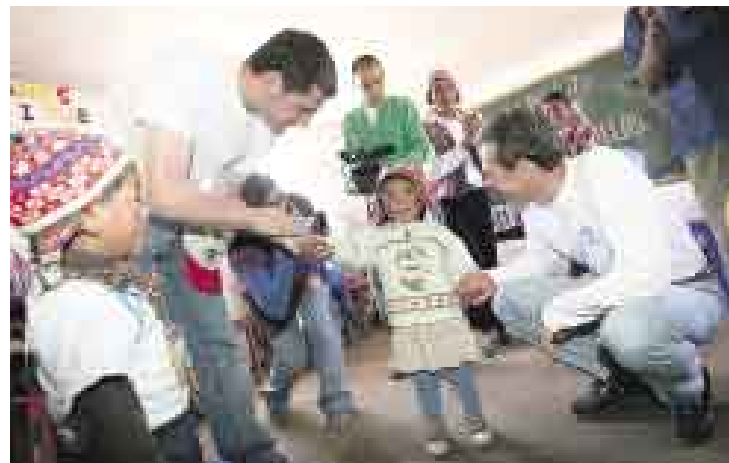
GRANDES. El gestor de la visita fue el ‘Buitre’ Emilio Butragueño.

“Me he quedado impactado de lo hermosa que es”, dice Iker. “Es bellísima, y su gente, fenomenal”, agrega el portero del Real Madrid. “Yo digo lo mismo –toma la posta el ‘Buitre’–, pero quiero decirles que me quedé muy encantado con el maíz (choclo). ¡j! Qué ma-