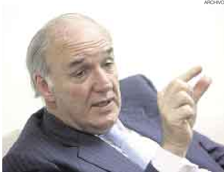
RESPECTOS GUARDAN RESPECTOS. El ministro de Relaciones Exteriores demanda que Bolivia deje de interferir en los asuntos internos del Perú.

“En ese comunicado dejamos demostrado, claramente, que el principio sagrado de las relaciones internacionales, que es el de la no intervención en los asuntos internos, está siendo violado, sistemáticamente, por el Gobierno de Bolivia. Esperamos que eso sirva para que, en el futuro, el señor Evo Morales se abstenga