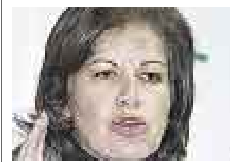
LOURDES FLORES NANO PDTE. PARTIDO POPULAR CRISTIANO

“El Apra está recibiendo de su propia medicina. No deberían quejarse, estamos en una democracia. Espero que el Gobierno escuche las propuestas de los huelguistas y que no haya acciones violentistas”.