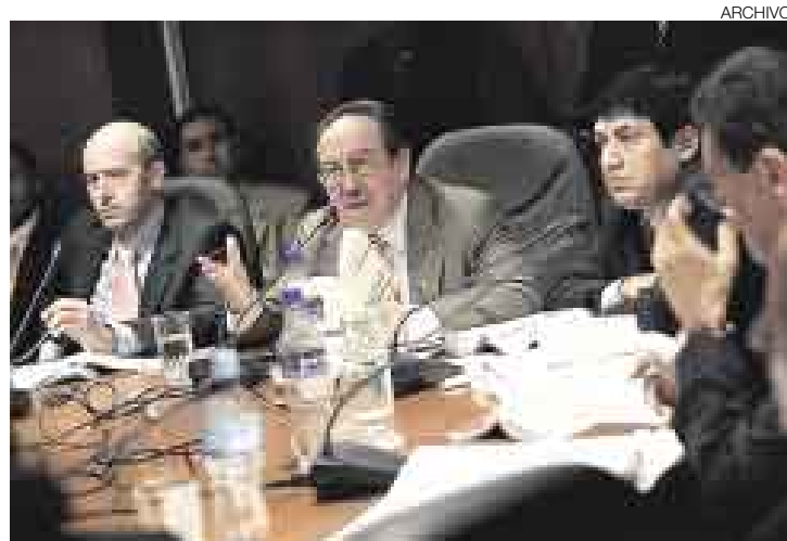
HASTA AGOSTO. La Comisión de Constitución del Congreso tiene una prioridad temática por atender: la revisión de los decretos legislativos

La Comisión de Constitución del Congreso tiene exactamente un mes para –revisando diez decretos legislativos por día– ejercer su función de control político sobre las casi cien normas legales que ha dictado el Poder Ejecutivo para la pronta implementación del tratado de libre comercio (TLC) vigente entre nuestro país y Estados Unidos.