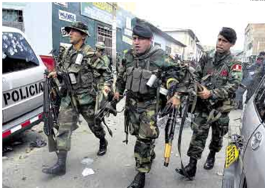
RESGUARDO CASTRENSE. El presidente García autorizó a las FF.AA. a apoyar a la policía desde el 8 al 10 de julio.

Según la disposición legal, la intervención de los institutos castrenses facilitará “que los efectivos