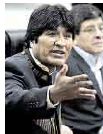
EN SUS TRECE. Evo Morales dice que seguirá con intromisiones.

Sin embargo, Evo Morales dijo ayer que continuará con sus acusaciones. “Vamos a seguir defendiendo la soberanía de Latinoamérica, no solamente de Bolivia”, decla-