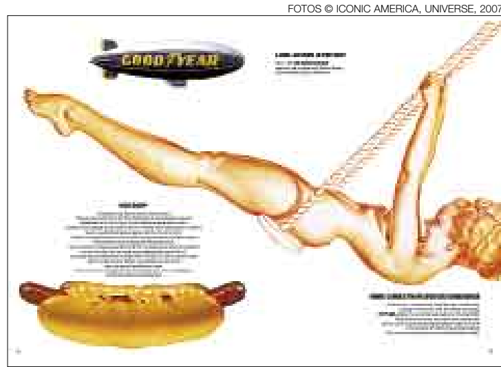
DISEÑO. Desde el ícono de Good Year sobre cielo estadounidense, pasando por el clásico hot dog, hasta las curvas de las pin up de los 40.

★ TOMMY HILFIGER PRESENTA UN COMPENDIO CON IMÁGENES DE LA CULTURA POP AMERICANA ★ PUBLICACIÓN VA UNIDA A UNA COLECCIÓN QUE RECAUDARÁ FONDOS PARA LA UNICEF