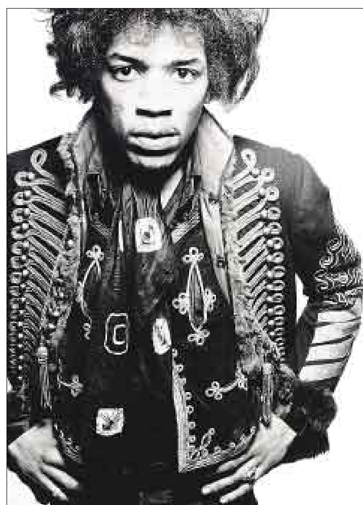
SUPERESTRELLA. Tommy Hilfiger recuerda la imagen de Jimi Hendrix prendiendo fuego a su guitarra en el Festival de Monterrey, en 1967.

LA LIBERTAD Y SUS BENEFICIOS. En este libro, George Lois buscó organizar el diseño de las páginas entrelazando el significado de cada ícono.