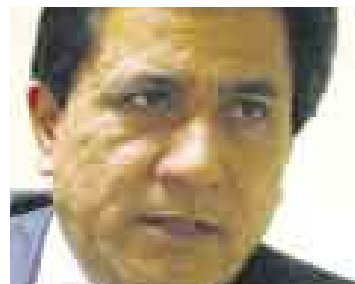
FERRADAS. No será acusado.

Un primer informe, cuestionado el mes pasado por la bancada oficialista, indicaba que la adición de la palabra ‘uno’ en el ar-