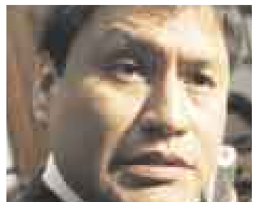
ESCUDERO. Falta evidencia.

La Comisión de Fiscalización del Congreso se declaró incapaz de señalar a un responsable intelectual en el caso de la adulteración de la Ley Orgánica del Poder Ejecutivo (LOPE) y solo recomendó sancionar a los funcionarios parlamentarios que ejecutaron los cambios a la norma aprobada en el pleno del Legislativo.