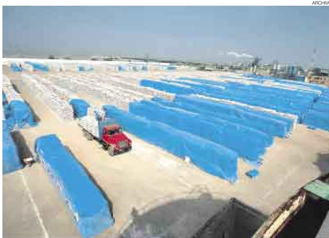
EMPIEZA EL JUEGO. China insistirá en un plazo prolongado de desgravación para la harina de pescado.

La versión fue confirmada por la Sociedad Nacional de Industrias (SNI). "Están queriendo restringir nuestros productos de peso, como la harina de pescado y el