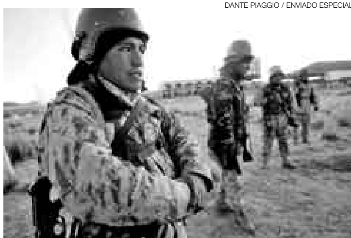
EN ALERTA. Los miembros de las Fuerzas Armadas solo resguardarán locales públicos y de servicios básicos, como el aeropuerto de Juliaca.

Asimismo, el ministro del Interior, Luis Alva Castro, precisó que