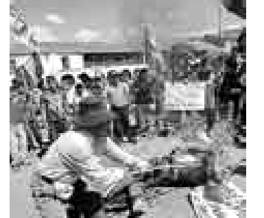
QUEMA. Campesinos destruyeron varias banderas en Huamanga.