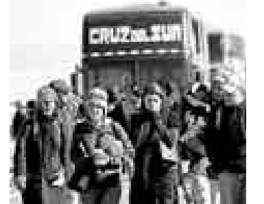
SUFRIDOS. Los turistas que llegaron a Puno tuvieron que caminar.

MINISTROS ASEGURAN QUE HABRÁ CLASES Y ATENCIÓN MÉDICA