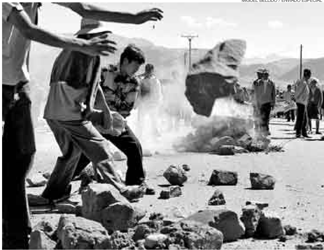
CONTRA EL DERECHO DE OTROS. Las fuerzas del orden tendrán que bregar duro para que el bloqueo de carreteras no se repita hoy. En el Cusco esta escena se repitió en varios puntos ayer, durante el paro agrario.

El pliego de reclamos de la CGTP, bandera de su protesta, se dio a conocer semanas atrás, pero Huamán volvió a recordarlo: la derogatoria de leyes antilaborales y de criminalización de las protestas; contra la venta de terrenos del suelo peruano a las transnacionales,