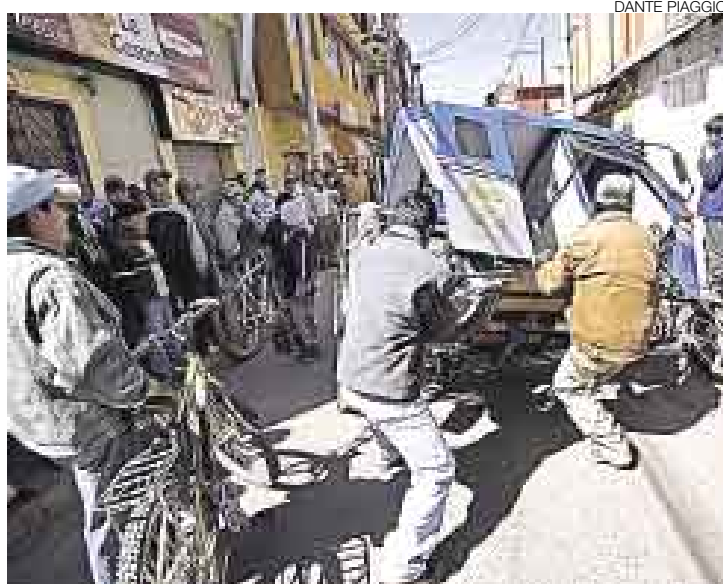
VIOLENCIA. Aunque no se registraron mayores incidentes en Juliaca, sí pudieron observarse lastimosos hechos como este.