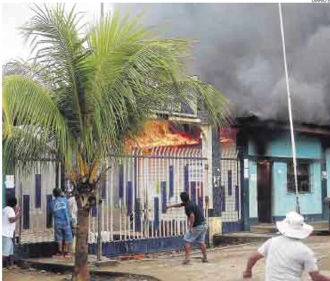
SIN CONTROL. Vándalos no dejaron llegar hasta la sede del gobierno regional a los bomberos de Puerto Maldonado. Pese a las llamas, continuaron destruyendo ventanas y puertas como pudieron.

Al mediodía, cuando se realizaba una masiva marcha por las calles de la ciudad, un grupo de exaltados, en su mayoría estudiantes universitarios, irrumpió por la fuerza en la subestación hidroeléctrica de Frías