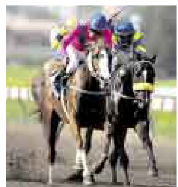
ESPECIAL. La sexta carrera es por el Día del Médico Veterinario.

(6) Apache 56 Ch. Aragón. - A pronte bien Hisham (1) – Divertido (5) – Apache (6)