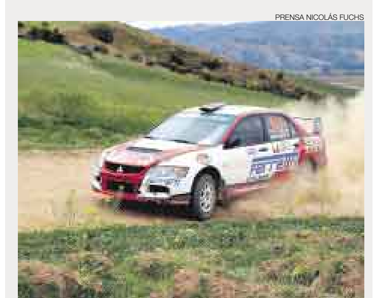
PRENSA NICOLÁS FUCHS