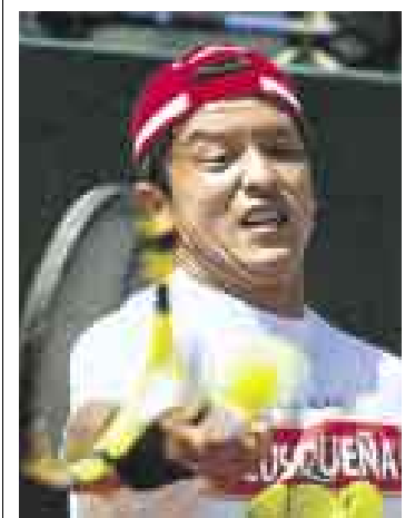
LÁSTIMA. En Ecuador lamentan que Miranda no juegue.

La enfermedad que lo regresó a Lima en pleno Challenger de Reggio Emilia en Italia hace tres semanas, no impediría que pueda competir en el Challenger de Belo Horizonte que se inicia el 28 de julio y el de Campos do Jordao en Brasil, así como en el del Bronxyla ‘qualy’ del US Open en agosto. “Pronto debo estar bien”, afirmó.