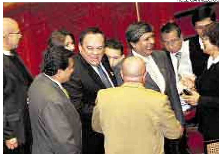
ASISTIÓ. El ministro del Interior Luis Alva Castro llegó al Congreso pero a oposición reclamó la presencia de Del Castillo. El premier irá el lunes.

El más incómodo por el impasse surgido fue el titular del Congreso, Luis Gonzales Posada, porque ninguno de la oposición le creyó que el oficio de disculpa firmado por Del Castillo había sido reci-