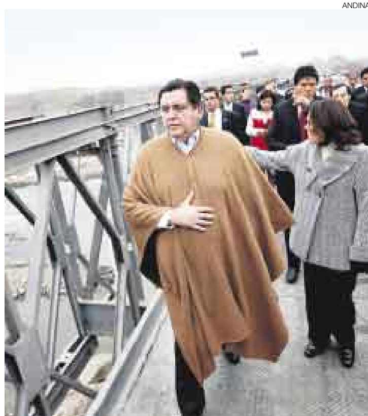
LLEGÓ EL 10. Mandatarario García inauguró puente en Carapongo.

Por todo esto pidió al Ministerio Público que actúe de oficio para dar con los autores e instigadores. “No hay nada que el Poder Ejecutivo pueda hacer”, aclaró. Horas después la ministra de Justicia, Rosario Fernández, señaló que el Gobierno investigará cómo ocurrieron estos actos violentos para determinar responsables. Entre los actos criticados