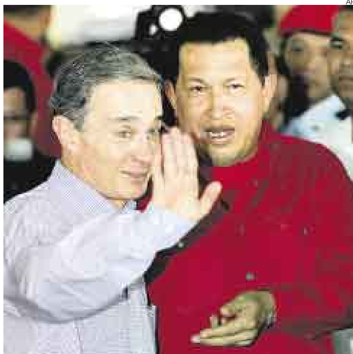
ENCUENTRO FRUCTÍFERO. La reunión entre Álvaro Uribe y Hugo Chávez en la venezolana localidad de Paraguaná sirvió para limar asperezas.

“Hemos decidido retomar, y lo hacemos a plenitud de sentimientos y voluntad, el camino que venimos construyendo... que bastantes cosas positivas logramos”, declaró Chávez.