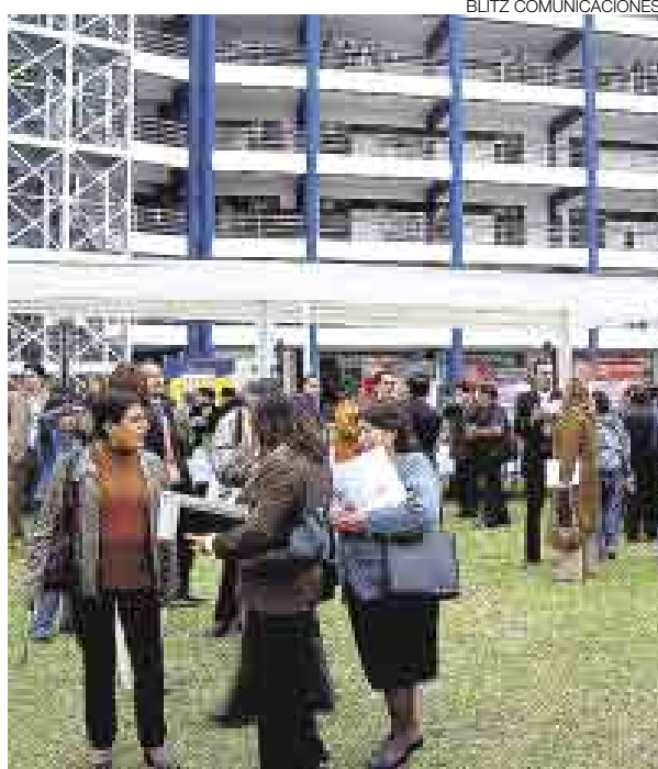
REUNIÓN. El encuentro se realizó el 24 y 25 de junio en la Universidad César Vallejo, en Los Olivos.

Al respecto se ha propuesto que los gobiernos municipales incrementen sus presupuestos para la promoción y desarrollo empresarial, que se institucionalice una feria internacional de Lima norte orientada a la exportación y se cree un