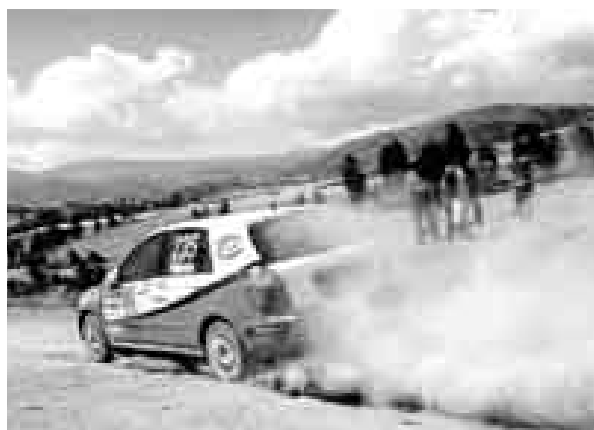
SEGUNDO. Fuchs tuvo problemas, pero sigue en la pelea.

"En la partida del sexto especial se rompió una cañería del embrague y perdimos 10 segundos", comen-