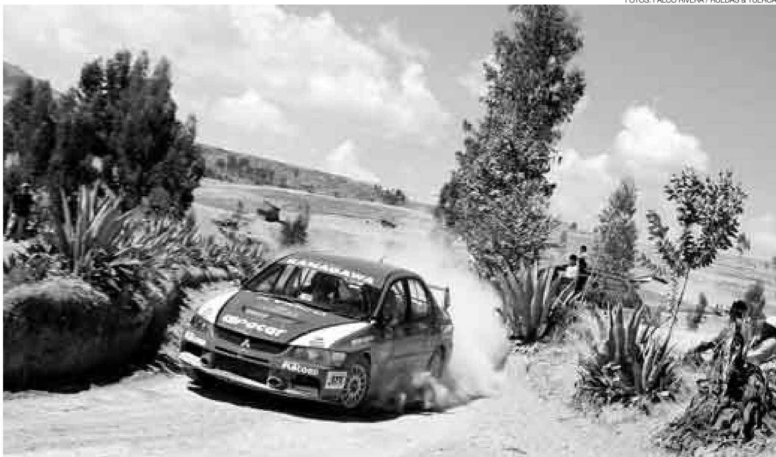
CANCHERO. El piloto Federico Villagra volcó toda su experiencia en el rally mundial para liderar el Codasur al finalizar la primera jornada.