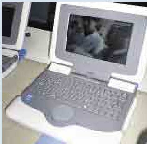
PRUEBA DE RIGOR. TÉCNICOS EVALÚAN EL RENDIMIENTO DE LOS EQUIPOS ANTES DE SU VENTA.

NETBOOK. INFORDATA PLANEA AHORA COMPRAR 1.000 UNIDADES MÁS. ESTAS LLEGARÁN AL PAÍS EN AGOSTO.