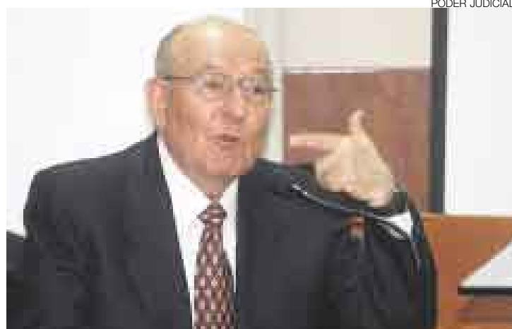
MEA CULPA. Hermoza Ríos ahora dice que fue un error sacar los tanques.

“No debieron salir, yo lo autoricé. Ese es uno de mis errores, asumo mi responsabilidad”, declaró en la audiencia 81 que se le sigue al expresidente Alberto Fujimori.