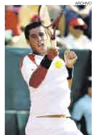
VAN. Silva es uno de los cinco peruanos que sigue en el Futuro 3.

La segunda ronda se disputará hoy, desde las 11 a.m.