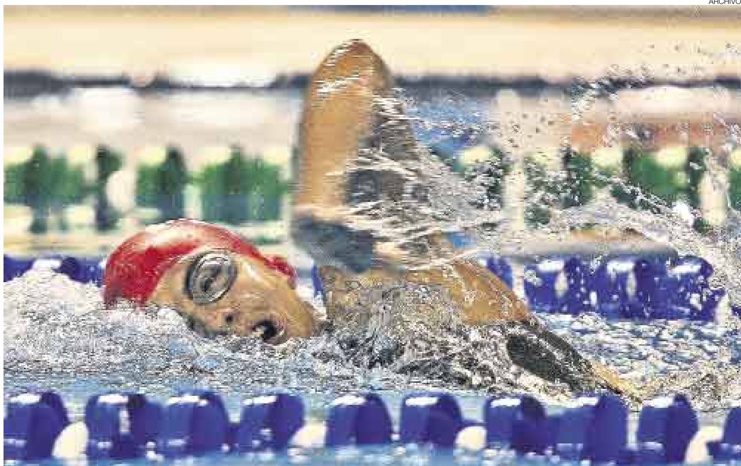
AL AGUA. El IPD libra una nueva pelea administrativa. Ahora su rival es la Federación de Natación, que se quedó sin la piscina del Estadio Nacional.