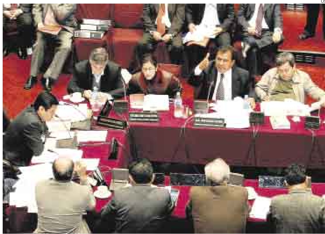
TODOS A UNA. La Comisión de Fiscalización cerró su año de labores con el informe del caso de la LOPE.

El informe también incorporó—a pedido del vocero aprista Javier Velásquez Quesquén—la recomendación de que estos tres funcionarios sean separados definitivamente del Poder Legislativo