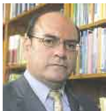
AL NORTE. Landa estará hoy en Piura con otros miembros del TC.

El magistrado del Tribunal Constitucional (TC) Ricardo Beaumont indicó ayer que durante la primera quincena de agosto dicho órgano resolverá el Caso El Frontón, es decir, se pronunciará sobre si este prescribió—y por lo