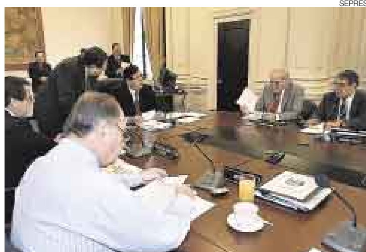
DEBUT. Luis Valdivieso, flamante ministro de Economía (primero de la derecha), se incorporó formalmente a las sesiones ordinarias del Gabinete.