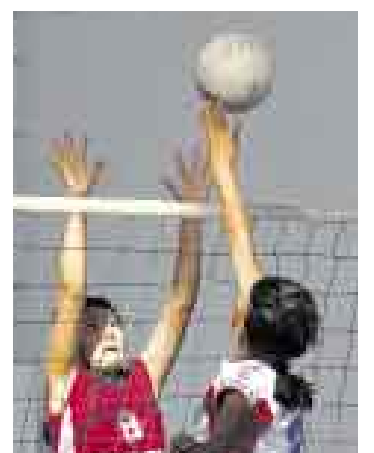
POR EL ORO. Hoy es la final del torneo de vóley en Huancayo.

Mientras tanto, las competencias de atletismo se desarrollarán mañana y el domingo 20 en el coliseo Huancayo.