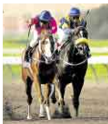
AL GALOPE. La jornada de hoy ofrece duelos emocionantes.