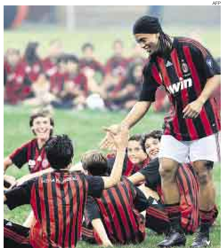
ATRACCION. Ronaldinho acapará todas las cámaras en Milán.

El astro cobrará 6,5 millones de euros por cada uno de los tres años que jugará en el club italiano, al que llega para ayudar a revertir una situación deportiva