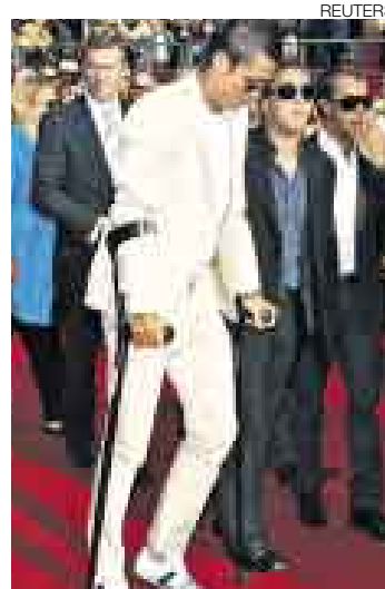
DUDA. El futuro de Cristiano Ronaldo aún es incierto.

En España dan por descontado que la transferencia del atacante del Manchester United se con-