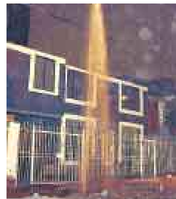
CHORRO. La fuga fue controlada por Sedapal en la madrugada.

■ Según el municipio, un borracho causó el accidente al empujar un bloque de cemento