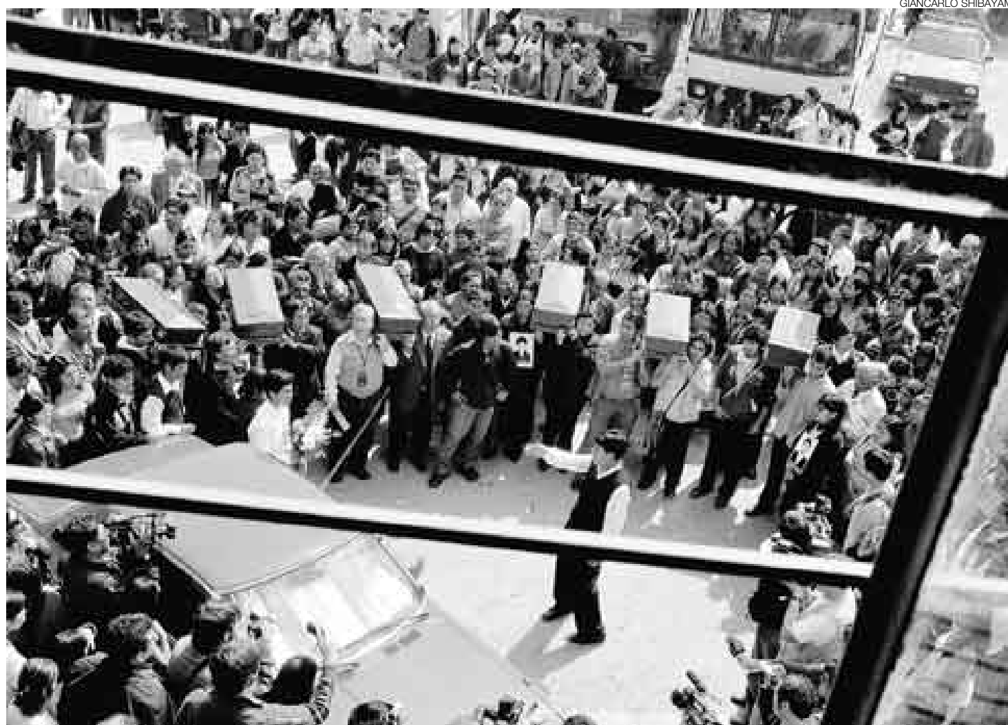
HOMENAJE. Seis féretros con los restos óseos de las víctimas fueron llevados a la Universidad La Cantuta, donde se realizó un emotivo velatorio.

En horas de la tarde los féretros fueron trasladados a la iglesia La Recoleta, en la plaza Francia, en el Centro de Lima, donde se realizó una misa de cuerpo presente. Ano-