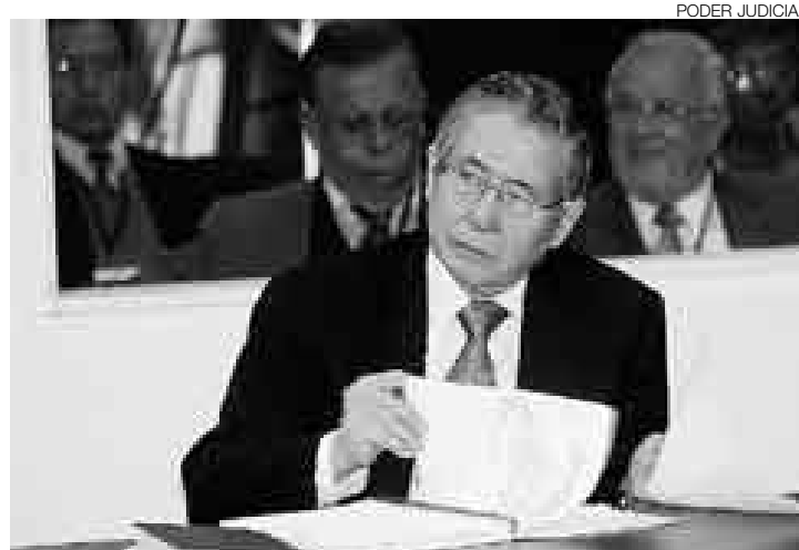
ACUSADO. Alberto Fujimori también está encausado por la matanza de La Cantuta. La Fiscalía ha pedido 30 años de prisión para él.

Hace pocos días el general (r) Nicolás Hermoza Ríos declaró que al día siguiente del crimen Vladimiro Montesinos le