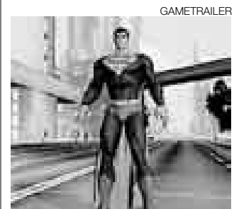
ESPERADO. Sea un superhéroe.

LOS ÁNGELES [AFP]. Entre las novedades mostradas en la exhibición E3 estuvo el videojuego de Sony DC Universe On Line, que permite a los aficionados del cómic crear su propio mundo de superhéroes.