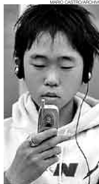
CAUTELA. Muchas veces no se da la información completa al usuario.

La CE presentó los resultados de una investigación en este sector en los países de la Unión Europea (UE), Noruega e Islandia, que muestran irregularidades en el 80% de las páginas analizadas, el 100% en España. Los tres principales focos de confusión para el cliente son el precio, el proveedor y la letra pequeña, según los resultados del estudio.