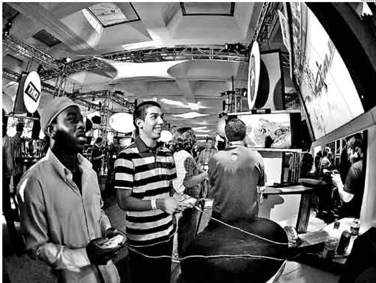
FELICES. Los asistentes a la E3 de este año tuvieron la posibilidad de probar los nuevos juegos presentados por las empresas del rubro.

Uno de los hechos que más resaltaron los bloggers que llegaron hasta Los Ángeles fue la exhibición de los excelentes tráileres de Fallout 3 (un juego que se desarrolla en una realidad postapocalíptica y que los especialistas ya consideran como la próxima obra de arte de los videojuegos), Far Cry 2, Ghostbusters, Resident Evil 5 (que incluye el