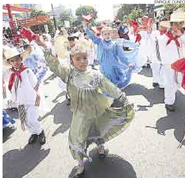
SENTIMIENTO LATINO. A pesar de que los unía la angustia por los rehenes de las FARC, peruanos y colombianos también se unieron en el baile.

niosas iniciativas fueron acompañadas por pancartas blancas y lemas que reclamaban paz y libertad. El presidente Alan García se sumó a sus ministros a la altura de la avenida 28 de Julio. Llevaba una bandera colombiana.