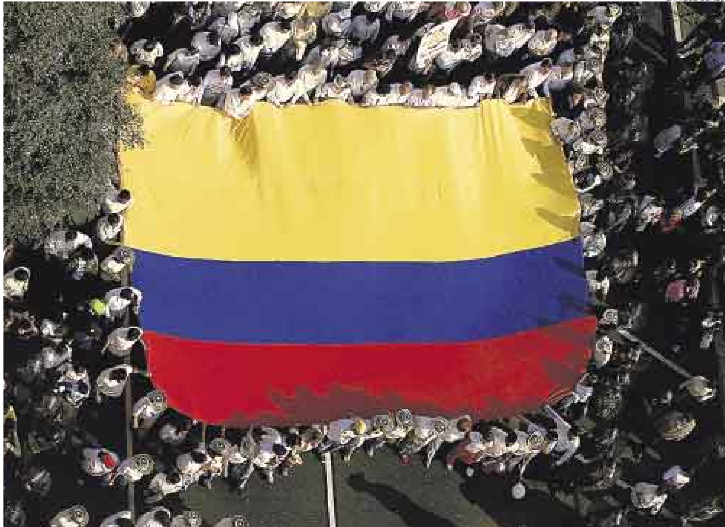
HACIA LETICIA. En la ceremonia que se realizará en Leticia, Colombia, el presidente Alan García entregará esta bandera a su homólogo Álvaro Uribe.

A las 3 p.m., como estaba previsto, la marcha se inició y abarrotó las 11 cuadras de la avenida Larco, en dirección al estrado que se había levantado en el óvalo de Miraflores. Danzas típicas, representaciones teatrales y otras inge-