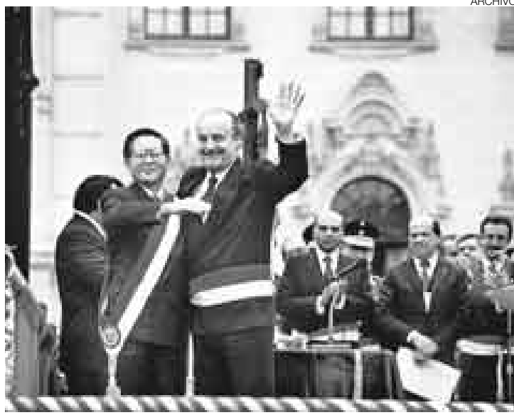
PÁNICO. Juan Carlos Hurtado Miller prácticamente nos dejó en manos de Dios luego de anunciar el histórico 'fujishock'.