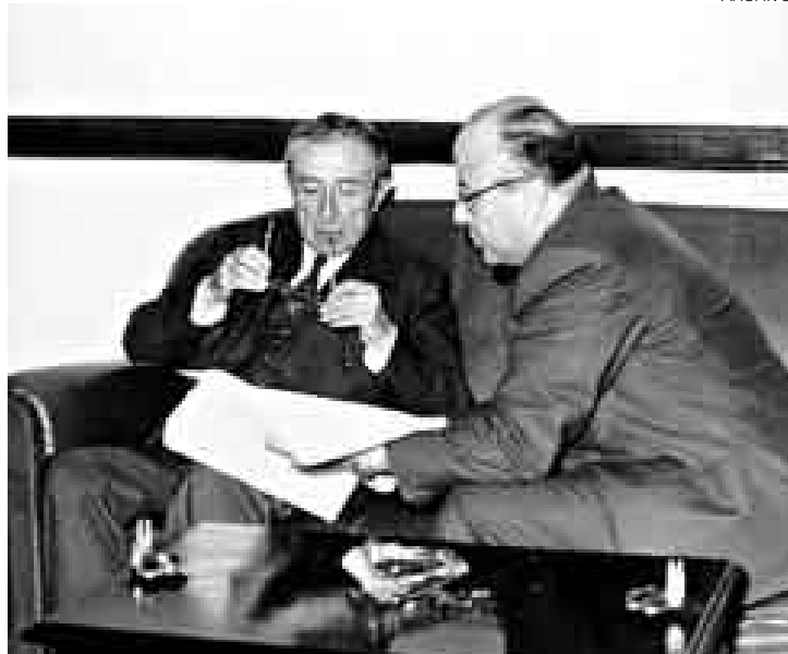
A SU CRÍTICO. En 1959, el presidente Manuel Prado le dio la cartera de Hacienda (hoy Economía) a Pedro Beltrán, uno de sus más férreos críticos.

Y contrariamente a lo que uno puede pensar, en la administración pública de entonces no hubo prejuicios por la edad. Por eso, si usted creía que el ex presidente Alejandro Toledo nombró al ministro de Economía más joven