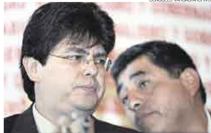
EX AMIGOS. De los secretitos, Torres y Espinoza pasaron a los ataques.