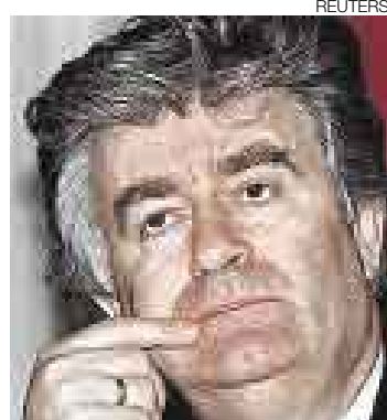
ANTE LA JUSTICIA. Radovan Karadzic es acusado de genocidio.

ha sido el principal reclamo internacional a Belgrado.