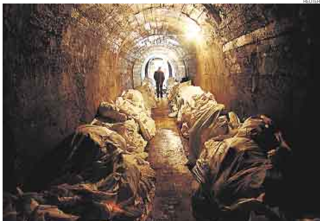
MASACRADOS. En esta imagen de marzo de 1997, los cadáveres atiborran un refugio subterráneo en Bosnia. Muchos de estos cuerpos fueron encontrados en áreas boscosas después de la matanza de Srebrenica, en 1995.

El arresto de Karadzic ha sido una sorpresa en Serbia, ya que desde hace años las autoridades se centran en la búsqueda del excomandante militar serbobosnio Ratko Mladic, que supuestamente se esconde en este país y cuyo arresto