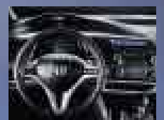
Tablero Dual (único en su categoría) y Transmisión S-Matic Sport (Paddle Shift**)