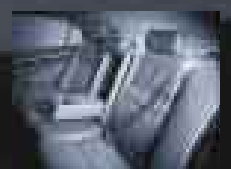
Disco plano para mayor comodidad interior. Único en su categoría.