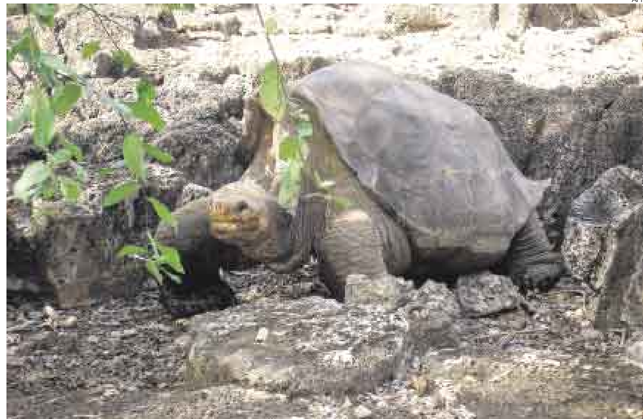
LO FLECHÓ CUPIDO. El solitario Jorge tiene 145 centímetros de largo curvo por 140 de ancho curvo y pesa 100 kilos.