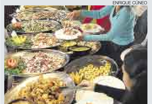
PURO SABOR. El cebiche y el pisco son considerados, entre otros, referentes de la marca país.