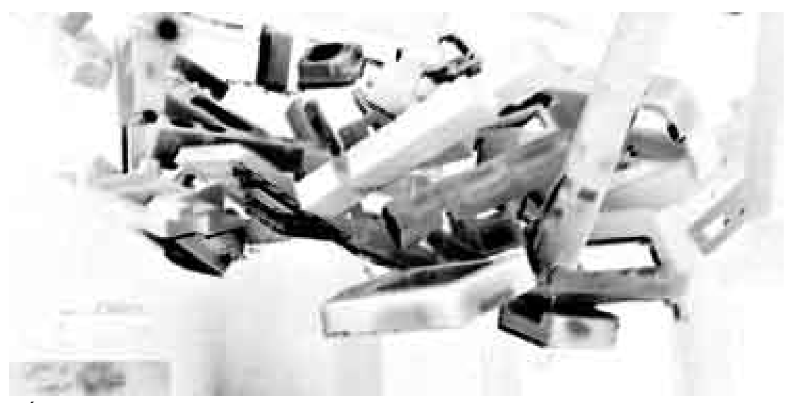
DIÁLOGO. Los artistas visuales generan mecanismos de interacción artificial ante la presencia humana.

La propuesta es el acrónimo de un estándar de la industria de tarjetas de video que, en inglés, significa 'video in-video out' ('vevoh'), mediante el cual —y desde una intersección arbitraria con