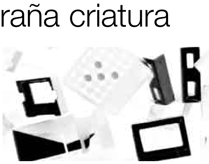
PECULIAR. Tecnopor, parlantes, proyectores y computadoras.

"'Vivo' es una instalación interactiva hecha de tecnopor reciclado, parlantes, proyectores y múltiples computadoras interconectadas que, a través de un sistema de sensores, responde de manera parcialmente im-