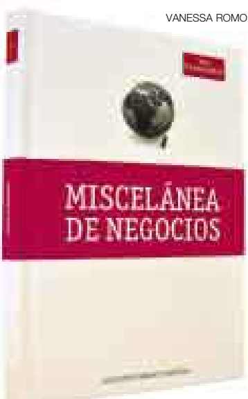
FINAL. Complete los 14 tomos de esta colección de The Economist.

No olvide que si dejó de adquirir alguno de los 14 tomos de esta colección, todavía puede encontrarlos, dependiendo del stock, en los quioscos y supermercados. ●