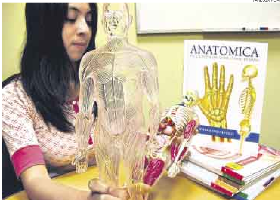
ARMANDO NUESTRO CUERPO. Cada entrega traerá un libro y una pieza para armar.

Cada libro trata de manera detallada los sistemas, órganos y funciones del cuerpo. Las secciones del capítulo están divididas en apartados y recuadros de color que traen textos generales, pero también especializados so-