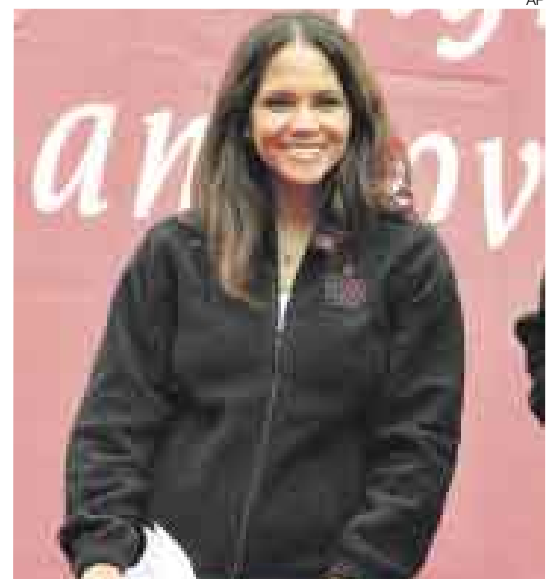
FIGURA PÚBLICA. Halle Berry acepta su exposición ante las cámaras, pero no quiere que sea así con su hija.

La actriz –que está decidida a mantener a su pequeña lejos de la visión pública– ha sentado una denuncia penal contra el fotógrafo, que al parecer vendió las imágenes a Fame Pictures. Estas fueron distribuidas y rápidamente publicadas en Internet y en dos revistas de celebridades.