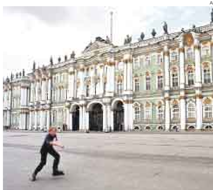
COLOSAL. El museo ruso ha sufrido duros golpes en los últimos años.