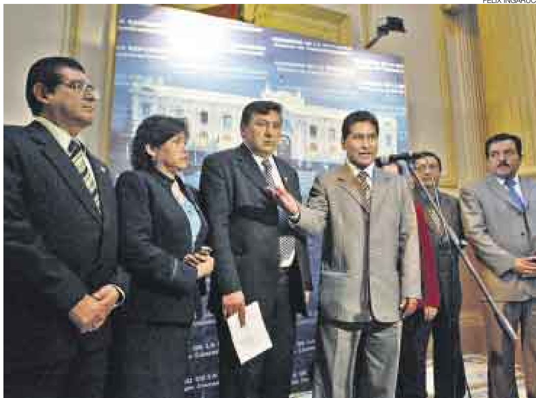
FACCIÓN APARTE. Siete upepistas marcaron distancia con correligionarios por hacerle el juego al aprismo.