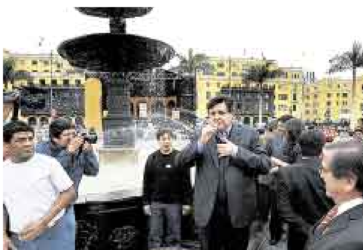
UN PISQUITO. El presidente de la República pasó unos minutos en la Plaza de Armas, donde probó de nuestra bebida de bandera.

“Leído el mensaje y conocido por todos los ministros los objeti-