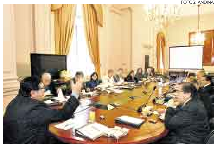
A MANO ALZADA. Luego de que los ministros dieran su opinión y sus aportes, el mensaje a la Nación fue aprobado por unanimidad.

■ En la víspera, jefe del Estado caminó por la Plaza de Armas y brindó con una copa de pisco