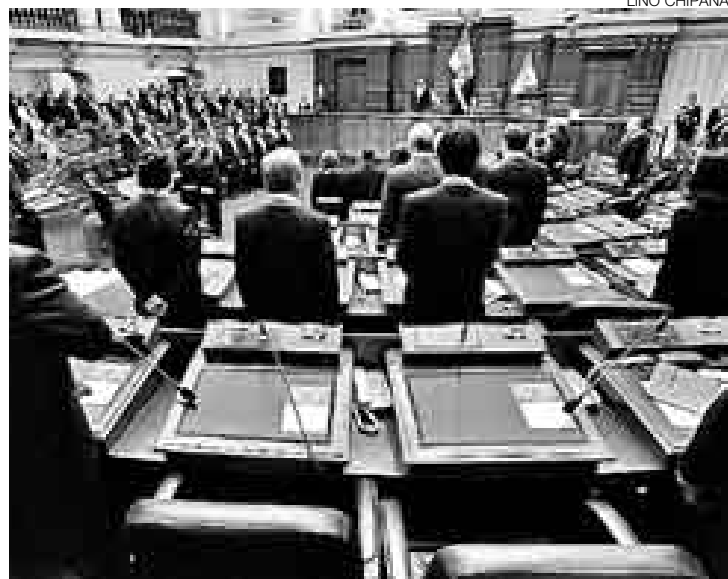
DESDE EL HEMICICLO. Precisamente desde el lugar que ha sido testigo de más de un escándalo, el presidente García llamó a reformar el alma.

“Ni lo material ni lo legal son suficientes. Nos falta todavía una reforma del alma que solo cada peruano puede impulsar desde su hogar. Que no haya violadores o padres que abusen de sus hijos, que no haya madres que sancionen a los niños quemando sus manos,