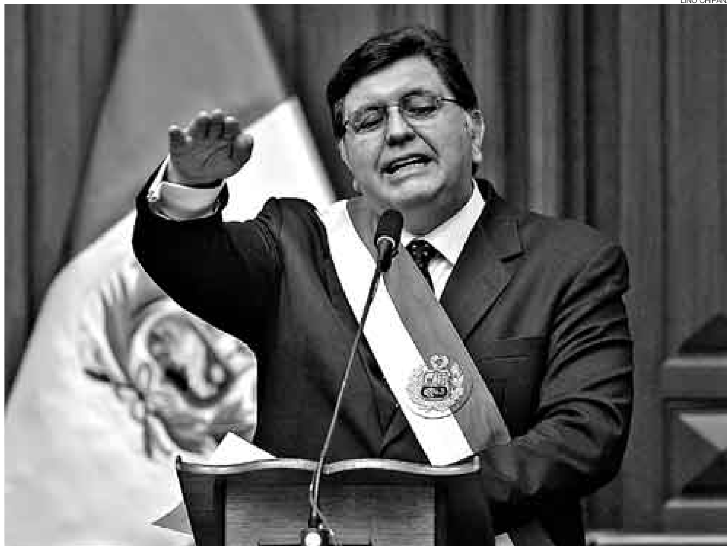
LA HORA CON DEMORA. El discurso presidencial arrancó casi veinticinco minutos después de lo previsto y duró más de hora y media.

Tras pedir comprender que se está ante un fenómeno universal, instó a actuar "con serenidad y madurez democrática" ante los obstáculos que se presentan. Empero, se comprometió a controlar severamente el aumento de los precios. "Yo sé que eso esperan de mí y del Gobierno las madres y las familias del Perú. Con inflación, ninguna obra